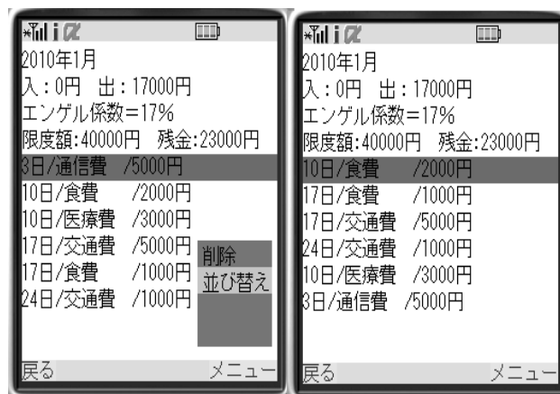
図 2. 家計簿 i アプリの動作例